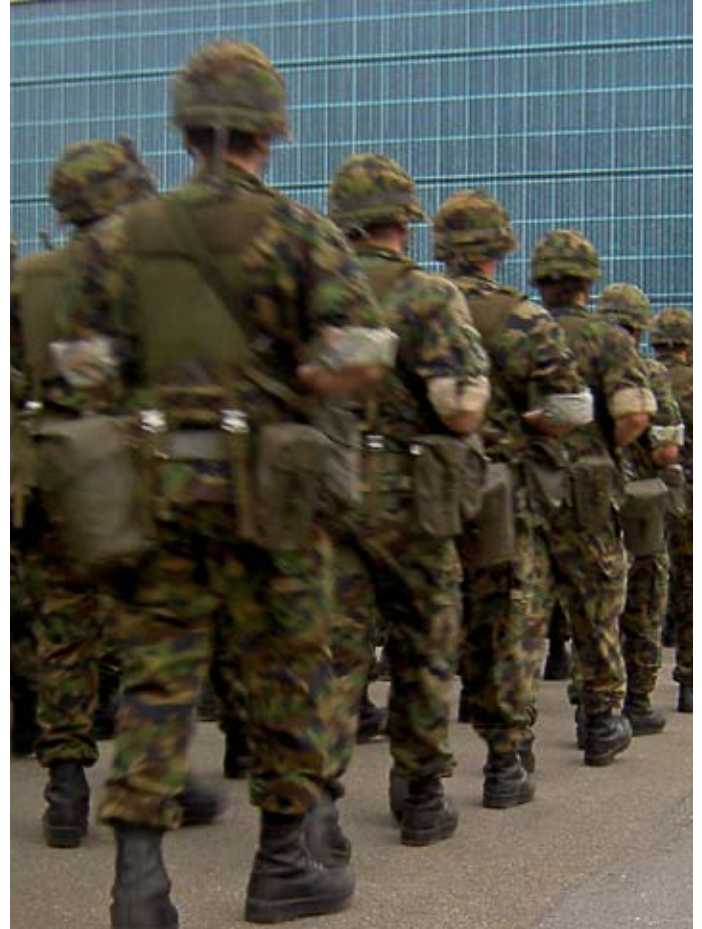
Kompanie im Vorbeimarsch.