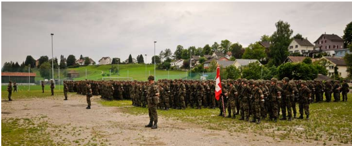
Das Inf Bat 70 in Formation. Als Kulisse diente das Sportzentrum in Herisau.

Gäste aus Armee, Politik und Amtsstelle sowie Zuschauer aus der Region wohnten der Zeremonie bei. Für die musikalische Unterlegung sorgte das Spiel der Rekrutenschule 16-1. ■