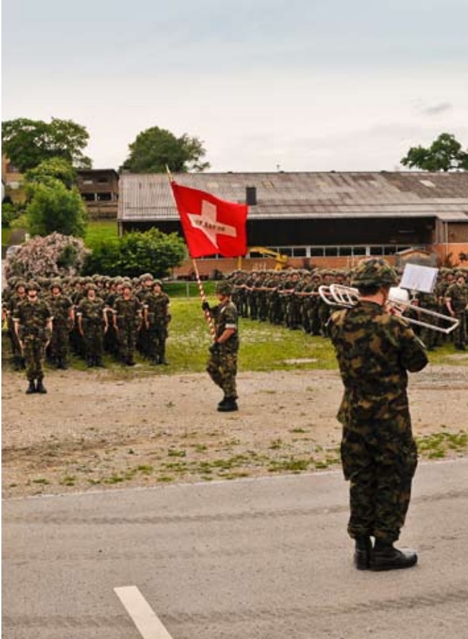
Fahnenmarsch, Vorwärts, Marsch.