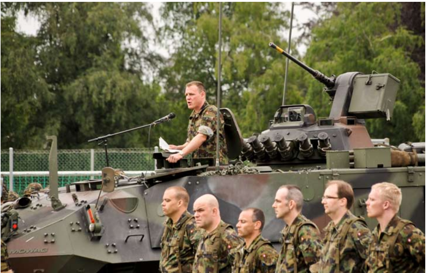
Bat Kdt Fritz ruft Kader und Truppe zu taktischer Kreativität auf.